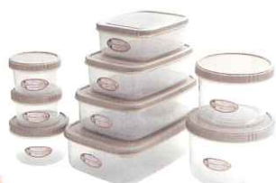
ジニアルベージュ

※印刷物のため、実際の色とは異なる場合がございます。商品の仕様は予告なく変更となる場合がございます。ご了承ください。