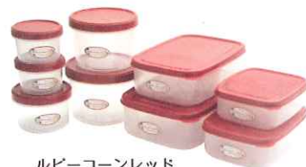
ルビーコーンレッド