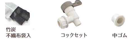
竹炭不織布袋 コックセット 中ゴム